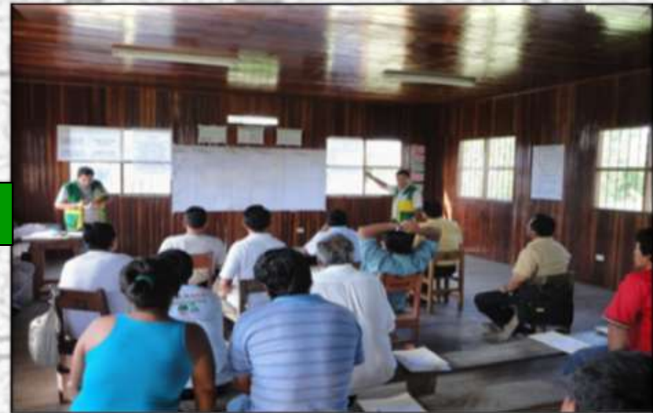
TALLER C.P. TACSHITEA