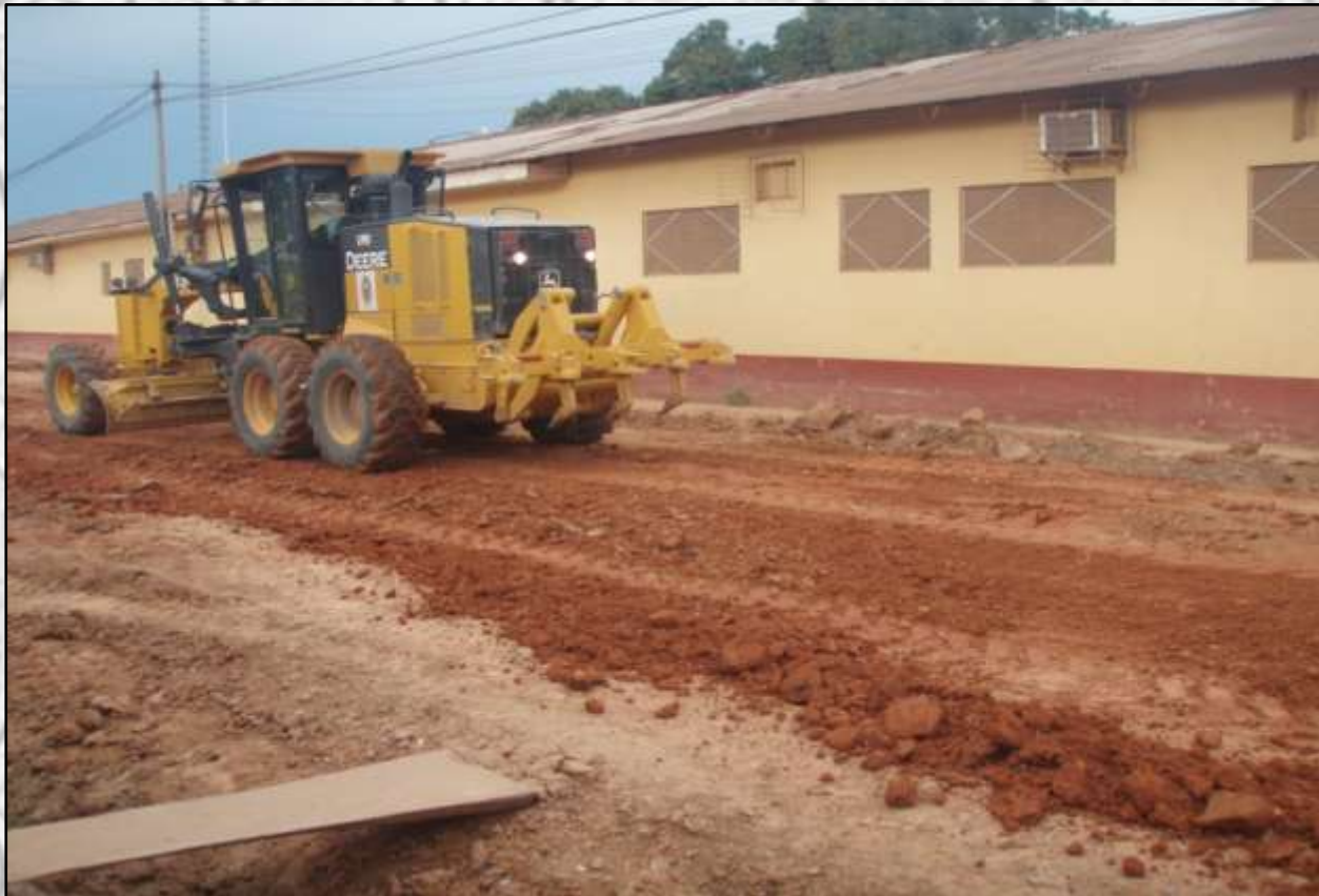
MANTENIMIENTO DEL JIRON PADRE AGUERRIZABAL