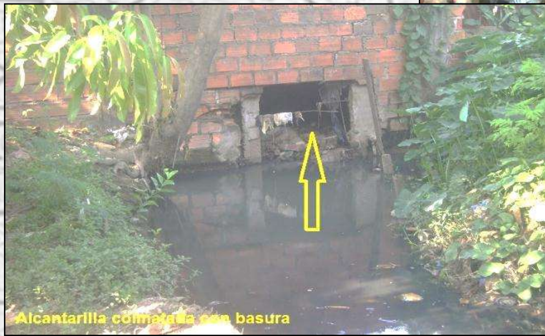
Alcantarilla colmatada con basura