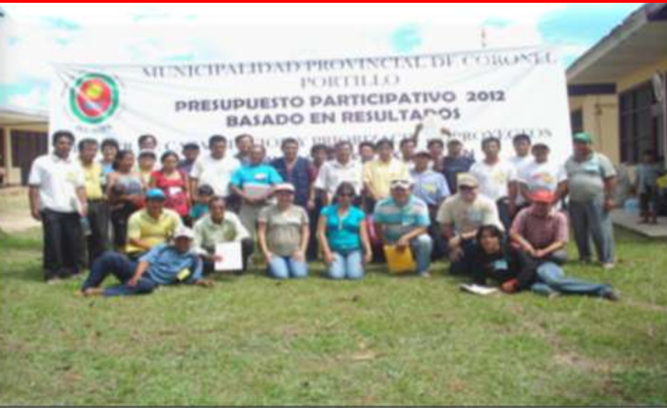
TALLER C.P. NUEVO SAN JUAN