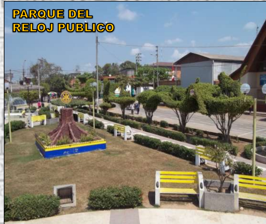
PARQUE DEL RELOJ PUBLICO